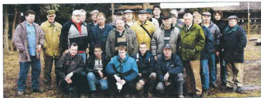
Členové klubu v Kotešovicích v roce 2004.

Po vyčerpání programu výborové schůze tuto předseda ukončil v 19 hodin.